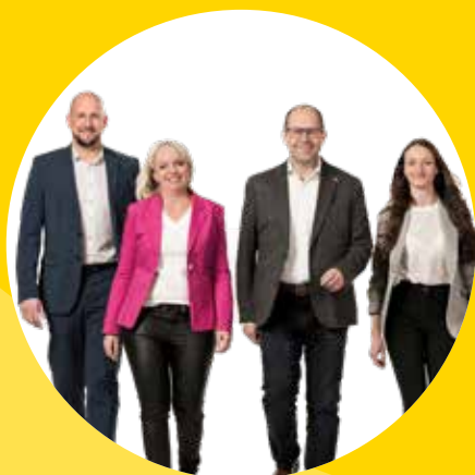
Unser Team für Maltern