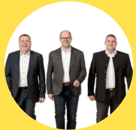
Unser Team für Burgerschlag