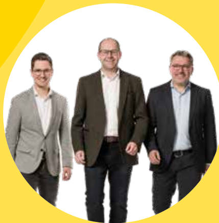
Unser Team für Harmannsdorf