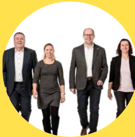
Unser Team für Ulrichsdorf