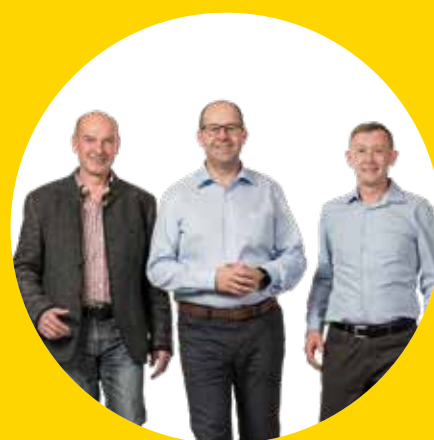
Unser Team für Offenegg