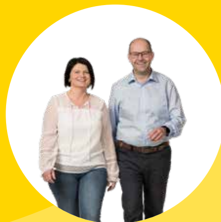
Unser Team für Züggen