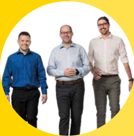
Unser Team für Kirchschlagl