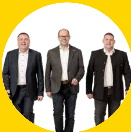
Unser Team für Gschaidt