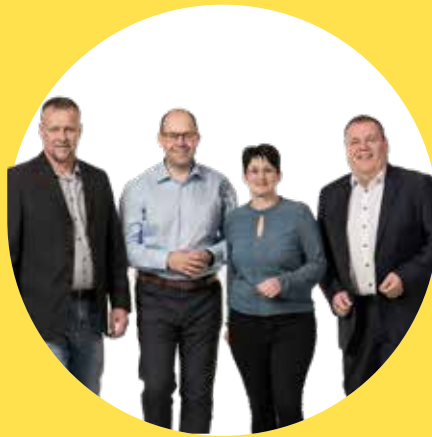
Unser Team für Grametschlag