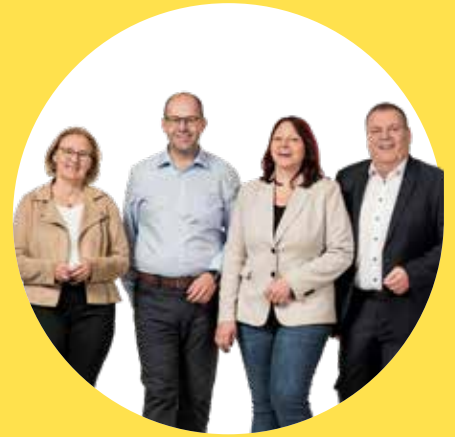
Unser Team für Hattmannsdorf