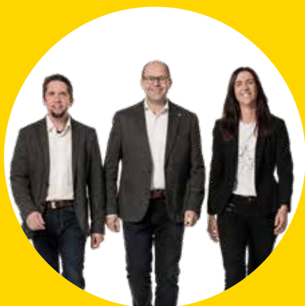
Unser Team für Hochneukirchen