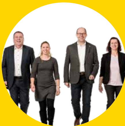
Unser Team für Loipersdorf